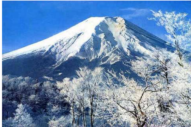
Mt. Fuji – besonders im Winter ein herrlicher Anblick

Di 19.01.27 + Di 02.02.27 / 5. Erlebnis-Tag: Heute unternehmen wir einen Tagesausflug in die Nähe vom Mt. Fuji – dem heiligen Berg. Wir fahren nicht in den Hakone Nationalpark (wie bei unserem Reise-Programm „Höhepunkte von Japan), sondern nach Kawaguchi-ko und kommen somit viel näher an den Mt. Fuji heran. In den Wintermonaten ist die Wahrscheinlichkeit sehr groß, daß sich der 3777 m hohe Berg mit Schneehaube bei bester Sicht zeigt. Rückkehr nach Tokyo und Übernachtung in unserem Hotel in Ginza.