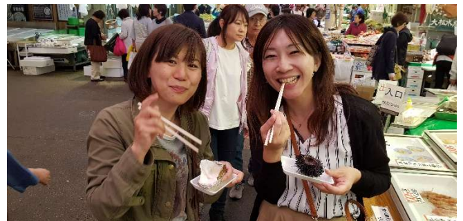
Austern und Seigel ganz frisch ... im Ohmicho-Markt von Kanazawa

Mi 20.01.27 + Mi 03.02.27 / 6. Erlebnis-Tag: Heute unternehmen wir einen Ganztagesausflug nach Nikko . Gleich nach Kyoto steht die „Barockstadt“ Nikko auf unserer „Best of Japan“-Liste ganz weit oben. Die Tempelanlagen von Nikko gehören - völlig zu recht - zum Weltkulturerbe der UNESCO. Eingebettet in eine malerische Berglandschaft bieten die verschiedenen Tempel Fotomotive in Hülle und Fülle. Wir fahren mit dem Shinkansen von Tokyo nach Utsonomiya und dann weiter mit einem Regionalzug nach Nikko. In Nikko besuchen wir die Shinkyo-Brücke, den großartigen Toshuga-Schrein, und den Rinno-ji-Tempel (dessen jahrelange Renovierung jetzt abgeschlossen ist) oder als Alternative gleich gegenüber einen schönen japanischen Garten.