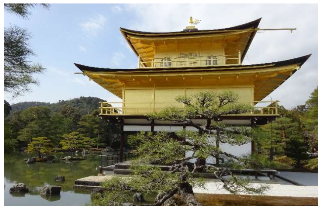
Wunderbar: der Goldene Pavillon in Kyoto