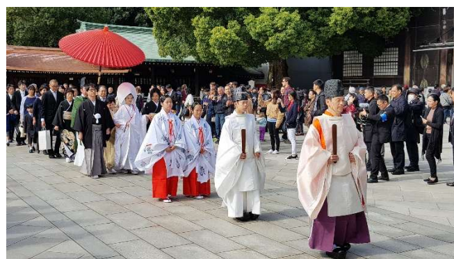
Hochzeit im Meiji Schrein

Sa 16.01.27 + Sa 30.01.27 / 2.Erlebnis-Tag Ankunft am Flughafen Narita oder Haneda. Fahrt nach Tokyo, Check-In im Hotel im Stadtteil Ginza und Übernachtung in Tokyo.