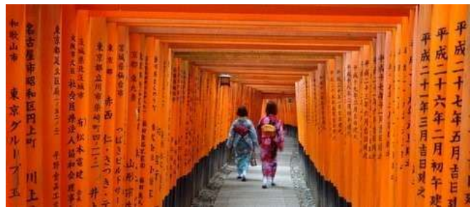
Immer ein Erlebnis: Besuch des Fushimi Inari-Schreines

Di 19.01.27 + Di 02.02.27 / 5. Erlebnis-Tag: Heute unternehmen wir einen Tagesausflug in die Nähe vom Mt. Fuji – dem heiligen Berg. Wir fahren nicht in den Hakone Nationalpark (wie bei unserem Reise-Programm „Höhepunkte von Japan), sondern nach Kawaguchi-ko und kommen somit viel näher an den Mt. Fuji heran. In den Wintermonaten ist die Wahrscheinlichkeit sehr groß, daß sich der 3777 m hohe Berg mit Schneehaube bei bester Sicht zeigt. Rückkehr nach Tokyo und Übernachtung in unserem Hotel in Ginza.