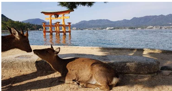
Insel Miyajima vor den Toren Hiroshimas

Sa 23.01.27 + Sa 06.02.27 / 9. Erlebnis-Tag: Fahrt mit dem Shinkansen von Kyoto nach Hiroshima . Hiroshima –die Partnerstadt von Hannover- ist ein „Muss“ für jeden Japan-Reisenden. Ein Besuch des „Memorial Peace Parks“ als Gedenkstätte zum ersten Atomwaffen-Einsatz gegen Zivilisten bleibt unvergesslich. Nach dem Besuch des „Peace Parks“ setzen wir mit einer modernen Fähre hinüber zur Insel Miyajima. Weltberühmt ist dort das hölzerne Torii aus dem Jahr 1875, das etwa 160 Meter vor dem Schrein steht. Bei Ebbe kann es zu Fuß erreicht werden, bei Flut steht es vollständig im Wasser. Es ist eines der meistfotografierten Wahrzeichen Japans. Der Schrein und das Torii wurden 1996 von der Unesco zum Weltkulturerbe erklärt. Wir werden zahme Rehe bewundern, die überall auf der Insel anzutreffen sind und keine Scheu vor Menschen haben. Rückfahrt mit dem Shinkansen nach Kyoto und Übernachtung im Hotel in Kyoto.