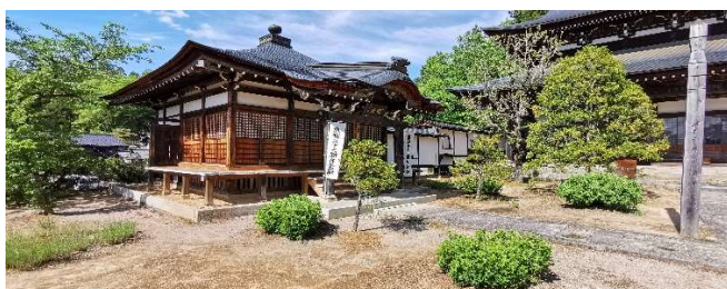
Takayama am Rande der japanischen Alpen

So 24.01.27 + So 06.02.27 / 11. Erlebnis-Tag Heute unternehmen wir einen Ausflug per Eisenbahn in das 60 Zug-Minuten entfernte Nara , Nara war von 710 bis 784 die erste permanente Hauptstadt Japans und ist daher noch älter als Kyoto. In Nara werden wir von hunderten zahmen, frei herumlaufenden Rehen überrascht. Überall gibt es Verkaufsstellen, die Futter für die Rehe liefern – die Rehe fressen uns das Futter aus der Hand. Unser Ziel ist jedoch der Todai-ji-Tempel , das größte Holzgebäude der Welt mit einer gigantischen Buddhastatue aus Bronze. Im Hirschpark von Nara besuchen wir auch die wunderschöne Tempelanlage Kasuga-Taisha-Schrein.... 3000 Steinlaternen säumen den Zugang. Rückfahrt von Nara nach Kyoto. Übernachtung in Kyoto.