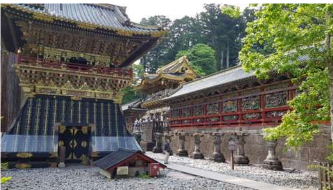
Unvergleichlich schön: die „Barockstadt“ Nikko

Do 21.01.27 + Do 04.02.27 / 7. Erlebnis-Tag: Tokyo-Kyoto Heute legen wir die 513 km lange Bahnstrecke von Tokyo nach Kyoto im Shinkansen ohne Umsteigen in 160 Minuten zurück; mit etwas Wetter-Glück haben wir unterwegs nochmals einen schönen Blick auf den Mt.Fuji. Nach Ankunft in Kyoto checken wir in unserem Hotel in Bahnhofsnähe ein. Am Nachmittag hat der stadtnahe Fushimi Inari-Schrein die besten Lichtverhältnisse zum Fotografieren. Der Schrein mit seiner kilometerlangen Tori-Galerie wurde durch den Film „Die Geisha“ weltberühmt.