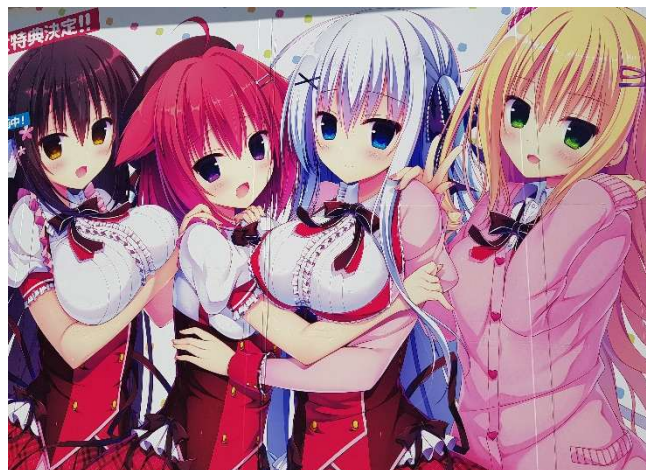
Herrlich verrückt: das Szene-Viertel Akihabara mit 1001 Foto-Motiven

Besuch eines japanischen Gartens im Luxushotel Besuch des berühmten Meiji-Schreins Besuch der Aussichtsplattform im Metropolitan Government Building in Shinjuku. Übernachtung im Hotel in Tokyo Ginza.